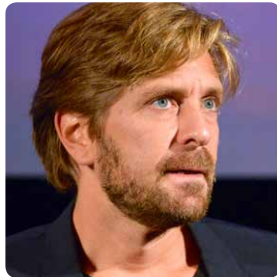
루벤 외스틀룬드 (Ruben Östlund)