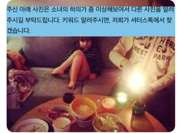
주신 아래 사진은 소녀의 하의가 좀 이상해보여서 다른 사진을 알려주시길 부탁드립니다. 키워드 알려주시면, 저희가 셔터스톡에서 찾겠습니다.