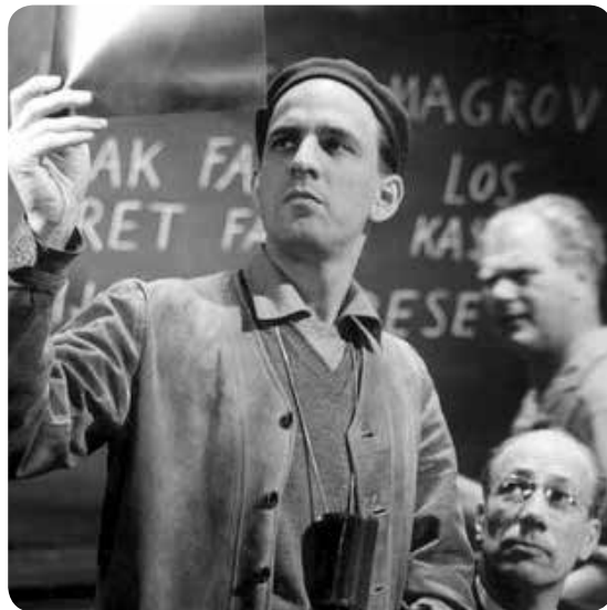
잉마르 베리만 (Ingmar Bergman)